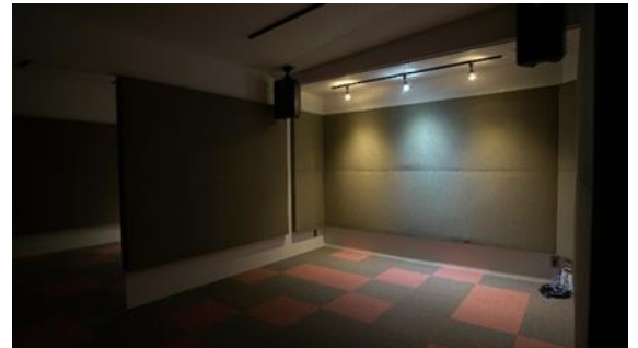
防音性能の高い2つのスタジオ