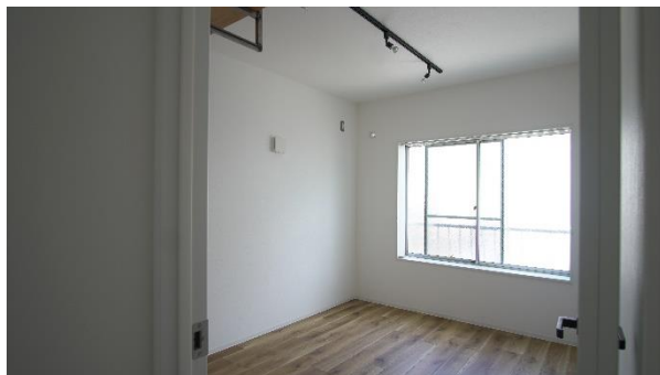
女性専用シェアハウス個室は7～7.5㎡全7室