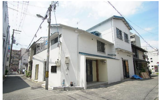
音楽スタジオ付きシェアハウス併設のコミュニティスペース「OTOGISOU」外観

実家を巣立って別の住居を構えたけれども、育てくれた家を残し地元で何かしたいと願う方がたくさんいます。そこで課題となるのが費用面の不安。今回の施主ご夫妻は当初より、アメリカでの生活で経験した「お金をかけず遊び、人と繋がることができる楽しみ」を日本で実践できる場所を指向されていました。そこで当社が提案したのが、シェアハウスの併設です。これにより、新しく定住する人と地域の人が接するコミュニティの場となり、家賃による収益安定も可能です。ご主人は「音楽を学ぶ学生や若者に住んでもらいたい」と次世代育成への想いを語り、シェアハウス入居者へスタジオ使用の特典を付けることにしました。奥様は、コミュニティスペースとシェアハウスを運営し、子ども・若者から高齢者まで幅広い年代層がつながる場の創出に挑みます。