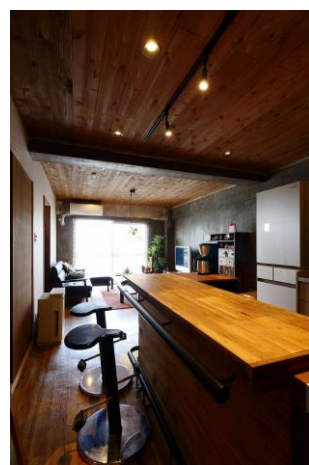
施主の母から受け継いだ桐ダンスをキッチンカウンターに。存在感のあるカフェ風キッチンが仕上がった。

今後は、5月に守口で1件、6月に3件、8月に八尾市、茨木市、大阪市で5件のカフェハウスが完成する予定です。