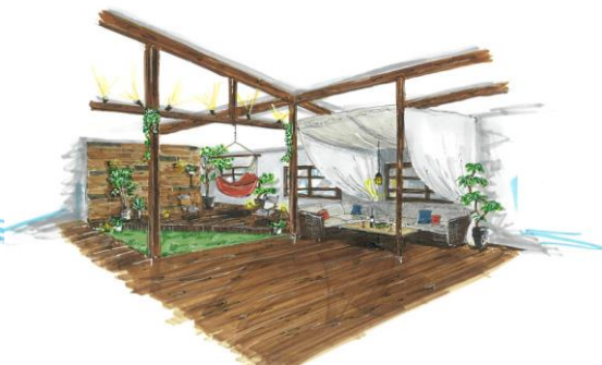
カフェ部分2階 イメージ図