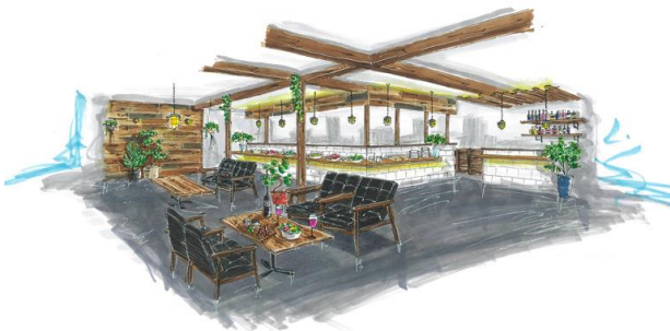
カフェ部分1階 イメージ図