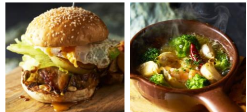
上) 店長セクション TODAY'S お肉ブラッター1680円/1人前。左下) 数量限定! 日本橋 BURGER(ランチセット)1300円。右下) ダッチオープン料理も多彩に用意。写真はエビとブロッコリーのアヒージョ 780円。