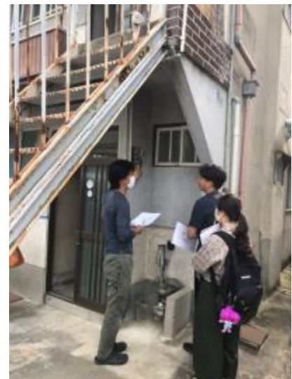
現場の確認には学生も同行

近鉄生駒駅周辺は、利便性が高く人口は多いのですが、人のつながりが希薄になりつつあります。「駒三ハウス」は築49年の木造アパートで、その1室に住む老夫婦（80代）は、人柄も良くお話好きにもかかわらず、近隣の新婚カップル等が住むアパートの住人とは交流がなく、つながりが薄い状態です。夢想空間はこれまで10年で200件以上の住宅や店舗のリノベーションや、大阪市港区と公民連携のまちリノベーションを手掛けてきました。今回リノベーションスクールでチームを組んだ奈良女子大学の学生と、スクール終了後、「実案件を収益物件にするービジネス経験ー」を通じ、地域の交流促進を目的とした「駒三ハウスリノベーションプロジェクト」を始動。6月に着工、9月完成を予定しています。9月の竣工お披露目イベントでは、ワークショップや懐かしの映画上映会などを開催予定です。