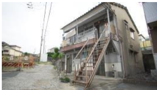
昭和46年に建てられた築49年の駒三ハウス （リノベーション前）